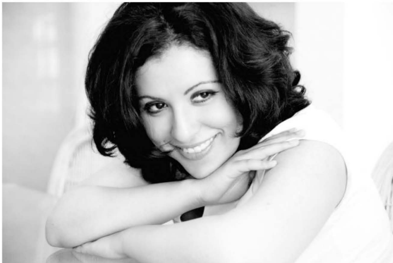
Previous page: Palacio de Bellas Artes, Mexico City.