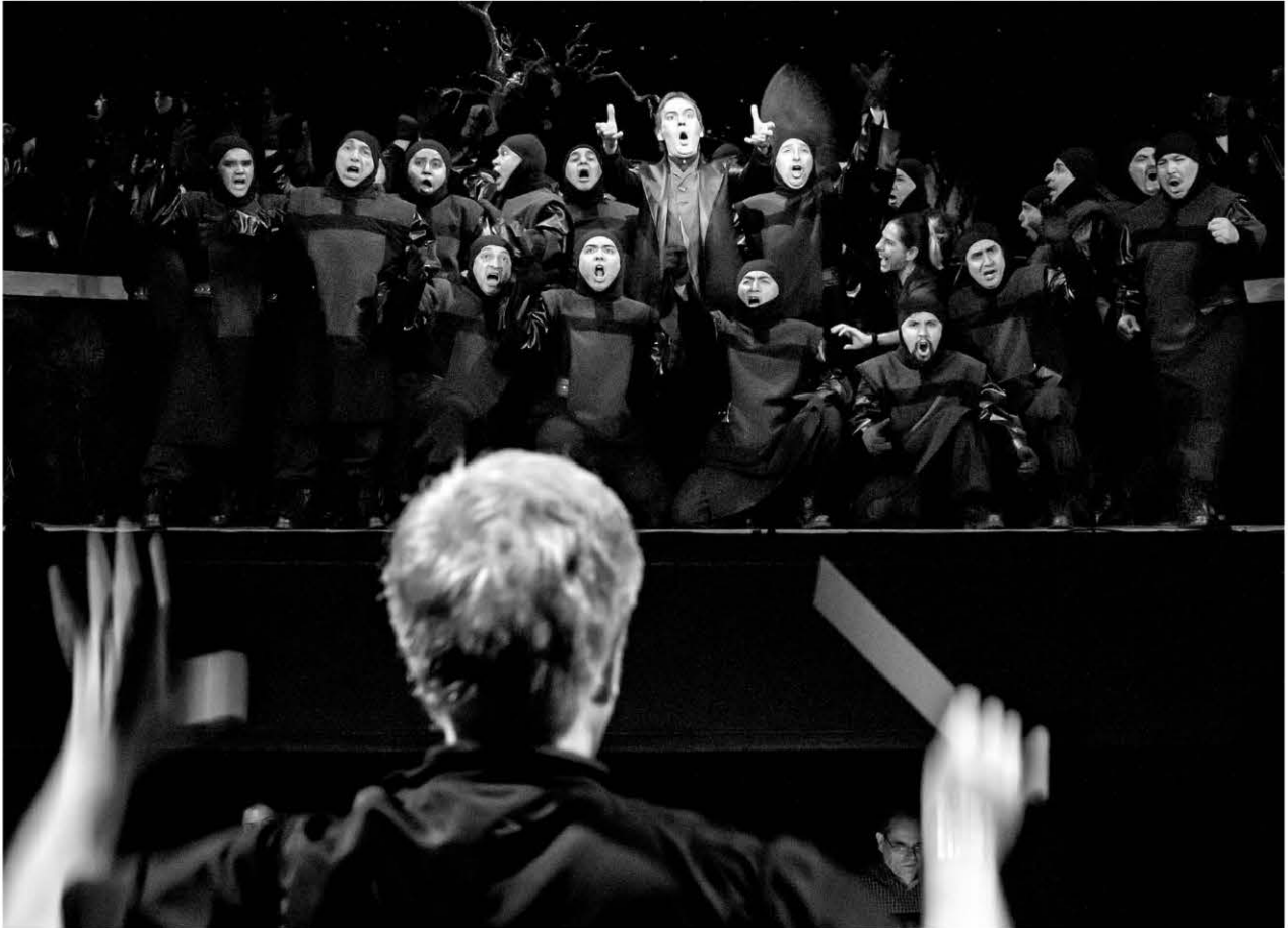
Enrique Patron de Rueda conducting ¡El Trovador! . Opera de Bellas Artes production, 2014.